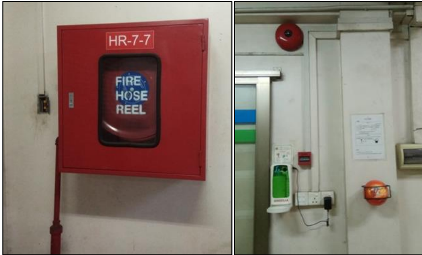
စက်ရုံအတွင်း/အပြင် Fire Horse Reel များတပ်ဆင်ထားရှိပုံ