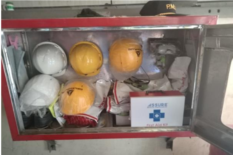
ဌာနအလိုက် PPE Box များစီစဉ်ထားရှိပုံ

၁။ ဝန်ထမ်းများလုပ်ငန်းခွင်ဘေးအန္တရာယ်ကင်းရှင်းရေး အတွက် လုပ်ငန်းအလိုက် လိုအပ်သော နှာခေါင်း စည်း၊ ခေါင်းစွပ်၊ လက်အိတ်၊ apron ၊ Safety Shoe ၊ Ear Plug ၊ Ear Muff ၊ High jacket ၊ Goggle ၊ Reflective Jacket ၊ First aid Box များထားရှိပေးထားပါသည်။