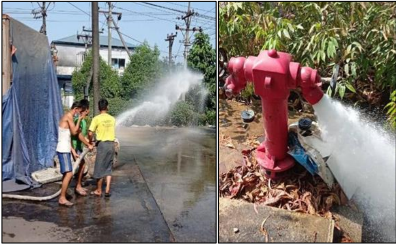
မီးဘေးကာကွယ်ရေးသင်တန်းပေးခြင်း