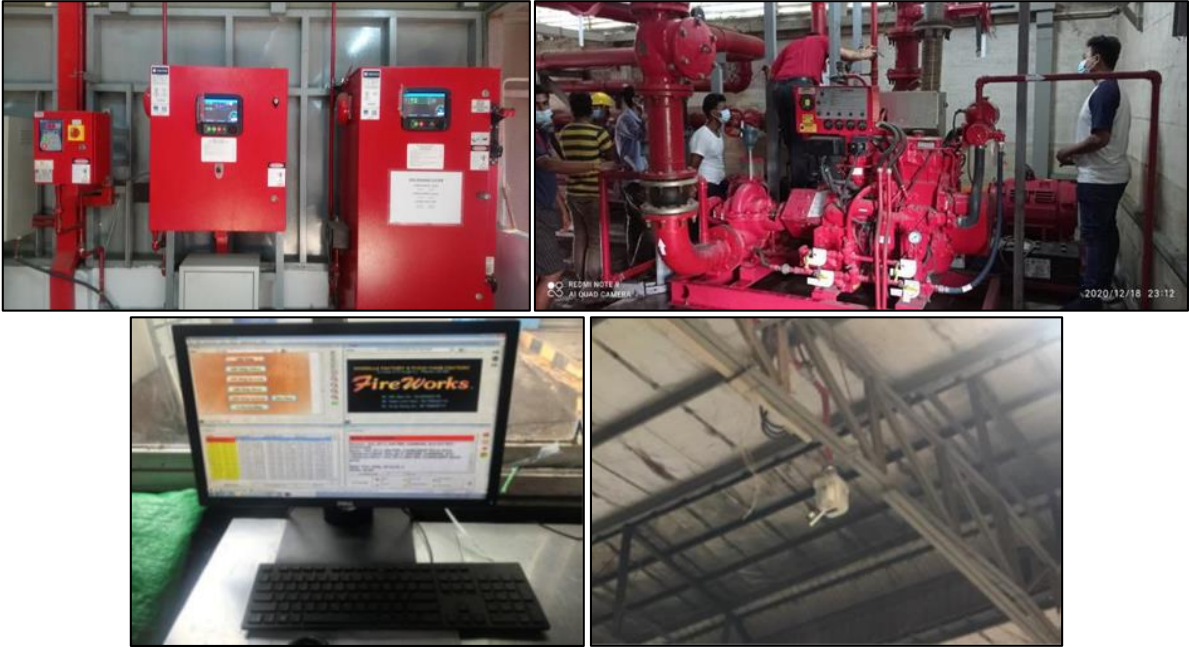
အလိုအလျောက်မီးသတ်စနစ်တပ်ဆင်ထားမှု

စီမံကိန်းလည်ပတ်သည့်ကာလအတွင်း ဝါယာလျှော့ဖြစ်ခြင်း၊ လောင်စာများစနစ်တကျ သိုလှောင်မထားခြင်း၊ ကုန်ကြမ်းနှင့် ကုန်ချောများစနစ်တကျမရှိခြင်း၊ လောင်စာဆီယိုဖိတ်ခြင်း စသည့် ပေါ့ဆမှုများနှင့် မတော်တဆမှုအမျိုးမျိုးကြောင့် မီးလောင်ကျွမ်းမှုများ ဖြစ်ပွားနိုင်ပြီး ထိုသို့ မီးလောင်ကျွမ်းပါက စီမံကိန်းလုပ်ငန်းအပြင် နီးစပ်ရာသို့ပါလောင်ကျွမ်းပြီး အသက်အိုးအိမ်စည်းစိမ်များ၊ ဆုံးရှုံးမှုများ ဖြစ်ပေါ်နိုင်စေပါသည်။ ထိုသို့ ဖြစ်ပွားခြင်းမရှိစေရန် လျှပ်စစ်ဝါယာကြိုးများအား ပုံမှန်စစ်ဆေးခြင်း၊ လောင်စာဆီများဖိတ်လျှိုပါက ပျံ့နှံ့ သွားခြင်းမရှိစေရန် မြောင်းစနစ်များထားရှိခြင်း၊ ကုန်ကြမ်းကုန်ချောများ စနစ်တကျသိုလှောင်ထားရှိခြင်း၊ အလို လျှောက်မီးငြိမ်းသတ်စနစ်များ တပ်ဆင်ထားရှိခြင်း၊ မီးသတ်ဆေးဗူးများအဆင်သင့်ဖြစ်နေစေရန် စီစဉ်ထားရှိ ခြင်း၊ မီးသတ်ဌာနနှင့် ဆက်သွယ်၍ စီမံကိန်းရှိဝန်ထမ်းများအား သင့်လျော်သည့် သင်တန်းများပေးအပ်ခြင်း တို့ကို ဆောင်ရွက်ထားပါသည်။