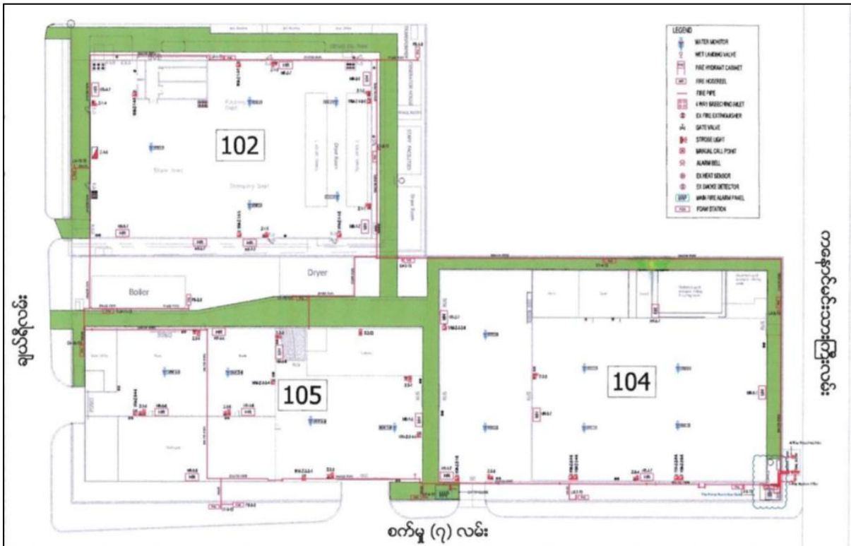
မီးဘေးအန္တရာယ်ကာကွယ်ရေးစနစ်